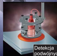
Detekcja podwójnych blach