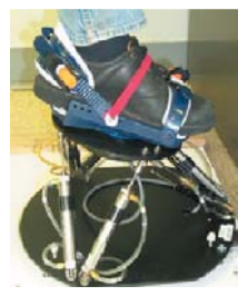
Rys. 5. Zastosowanie robota Rutgers Ankle w rehabilitacji stawu skokowego [2]

Na Uniwersytecie Rutgersa (New Jersey, USA) zbudowano robot o kinematyce równoległej, nazwany Rutgers Ankle [2]. Robot ten powstał na bazie platformy Stewarda z użyciem pneumatycznych elementów wykonawczych i sterujących, ma sześć stopni swobody. Roboty Rutgers Ankle mają zastosowanie w rehabilitacji kończyn dolnych. Zastosowanie robota równoległego Rutgers