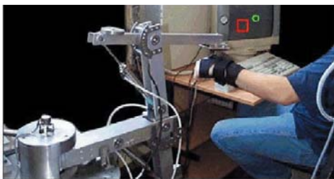
Rys. 3. Zastosowanie robota fizjoterapeutycznego do usprawniania ramienia [7]

W Szkole Inżynierii Mechanicznej na Uniwersytecie w Leeds (UK) powstał pneumatyczny robot fizjoterapeutyczny o strukturze szeregowej, służący do usprawniania pacjentów z dysfunkcją ręki [11]. Widok robota fizjoterapeutycznego wykonującego ćwiczenia ręki przedstawia rys. 3. Robot taki zwiększa efektywność i poprawia skuteczność ćwiczeń, zmniejsza koszty i skraca czas rehabilitacji osób niepełnosprawnych. Ruchy robota można zaprogramować zgodnie z wymogami terapeutycznymi danego pacjenta. Zadane ćwiczenia ruchowe można powtarzać precyzyjnie i wielokrotnie, ze zmienną amplitudą i prędkością, przy regulowanej sile działającej w określonym kierunku. Szczególną uwagę zwraca się na wzorce ruchowe stosowane w znanych metodach rehabilitacyjnych. Ruchy terapeutyczne zaprogramowane metodą play-back przez doświadczonego fizjoterapeutę powtarza robot fizjoterapeutyczny. Więcej na temat tego typu robotów można znaleźć w publikacji [6].