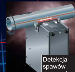
Detekcja spawów na rurach

Contec Sp. z o.o. od 1998 roku wspiera polski przemysł oferując wysokiej jakości produkty do automatyzacji i modernizacji procesów przemysłowych. Współpraca z głównymi dostawcami na całym świecie pozwala nam zaoferować kompletne rozwiązania i doradztwo techniczne dla wszystkich sektorów produkcji, a nasza dobrze przygotowana kadra służy Państwu najlepszą pomocą.