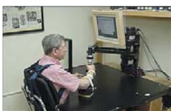
Rys. 4. Zastosowanie robota terapeutycznego MIT-Manus do ćwiczeń przegubu ręki [3]

Przodujący na świecie Instytut Technologiczny (Massachusetts Institute of Technology, Boston USA) od 1992 roku prowadzi pionierskie badania nad wprowadzeniem robota terapeutycznego Therapy Robot MIT-Manus o pięciu stopniach swobody z 16-bitowym przetwornikiem siły i ruchu [3]. Zastosowanie robota terapeutycznego do ćwiczeń prze-