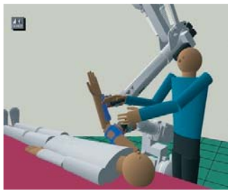
Rys. 1. Symulacja współdziałania pacjenta, fizjoterapeuty i robota w systemie REHAROB [7]

bota w systemie REHAROB przedstawia rys. 1. Od 1995 roku są realizowane projekty badawcze dotyczące zastosowania systemów telematyki, które są wykorzystane w monitorowaniu telerehabilitacyjnym poprzez Internet za pomocą oprogramowania JAVA 3D [4]. W Polsce są bu-