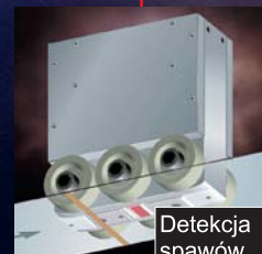
Detekcja spawów w arkuszach