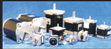
Silniki krokowe 2-, 3- i 5-fazowe do 6,3 Ncm przekładnie planetarne do silników