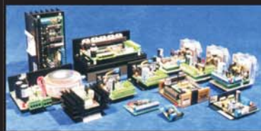
Sterowniki silników krokowych kontrola ruchu, choppery z mikro krokiem