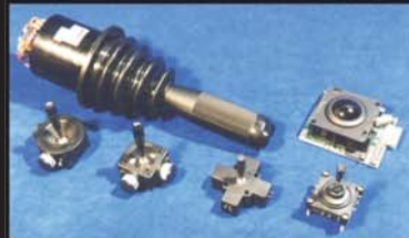
Manipulatory i trackballe z potencjometrami precyzyjnymi, bezstykowe, do zabudowy

powania kończy się udzieleniem patentu europejskiego, następuje publikacja o udzieleniu patentu europejskiego. W ciągu dziewięciu miesięcy od tej daty każda osoba może złożyć w EUP sprzeciw wobec udzielenia patentu europejskiego. EUP zawiadamia o złożeniu sprzeciwu właściciela patentu, a sam dokonuje badania zasadności sprzeciwu i wydaje odpowiednie decyzje.