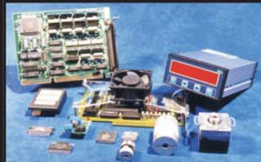
Osprzęt silników, Indeksery, zadajniki, załączacze, sprzęgła karty kontroli ruchu do PC, chipy stopni mocy i kontroli ruchu