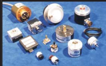
Przetworniki optoelektroniczne obrotowo-impulsowe, obrotowo-kodowa, pomiarowe, przemysłowe