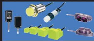
Czujniki zbliżeniowe Indukcyjne, fotoelektryczne, pojemnościowe, światłowodowe