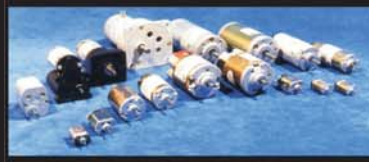
Silniki prądu stałego komutatorowe od 1do 300W Z przekładnią zębatą lub planetarną, akulatory, silowniki liniowe DC