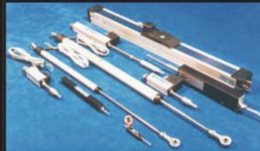
Przetworniki do pomiaru przemieszczeń liniowych potencjometryczne, indukcyjne, magnetostrykcyjne, linkowe